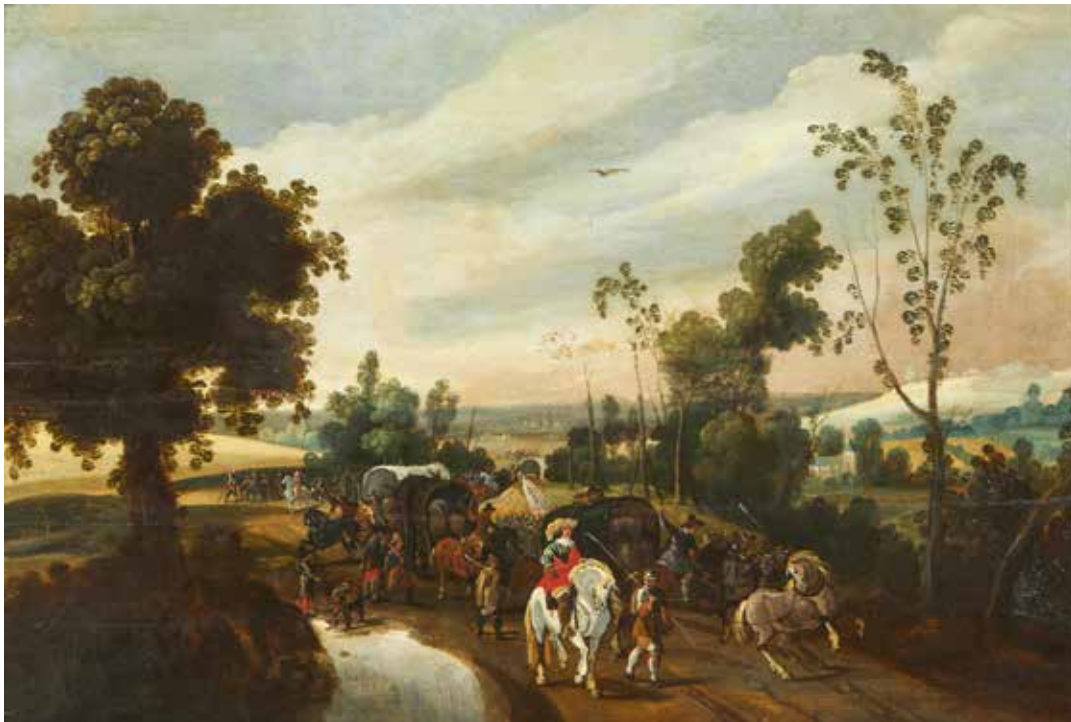
388 Ecole FLAMANDE vers 1640, suiveur de Sébastien VRANCX Convoi militaire à l'entrée d'un village Panneau de chêne parqueté Hauteur : 45,2 cm Largeur : 67 cm Restaurations anciennes, fentes.