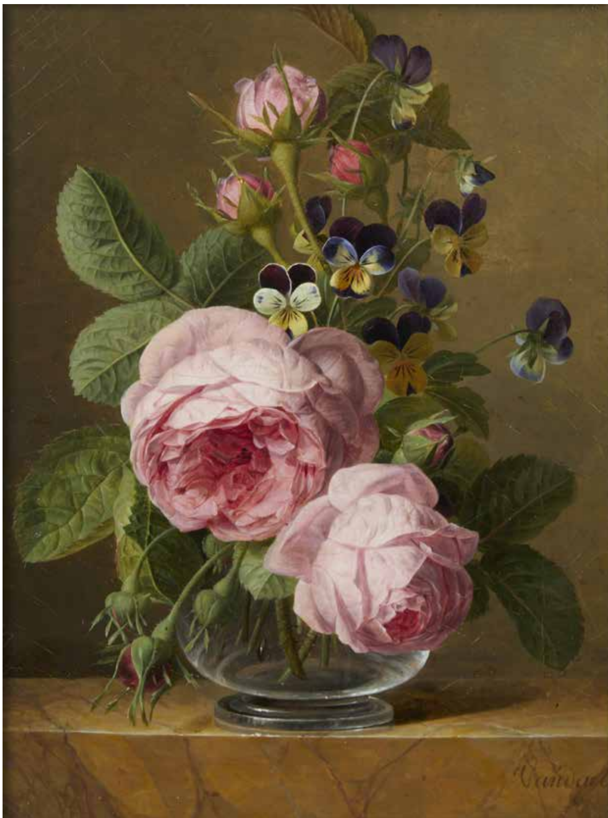
422 Jan Frans Van DAEL (Anvers 1764 - Paris 1840) Roses et pensées dans un vase de verre sur un entablement Toile d'origine de Belot Hauteur : 32 cm Largeur : 24,5 cm Au revers marque de l' entoilleur : " BELOT / Rue de l'Arbre Sec / N ° 3" Signé en bas à droite: Vandael Restaurations anciennes