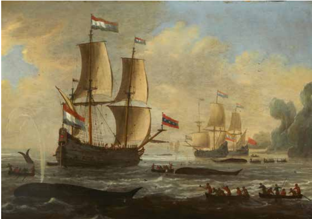
387 Attribué à Peter van den VELDE (1634 - après 1687) Chasse à la baleine dans le grand nord Panneau Hauteur : 58 cm Largeur : 81 cm Restaurations anciennes