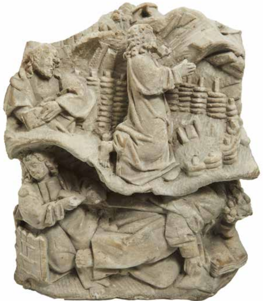
301 Saint Pierre Sujet en pierre sculpté Bourgogne fin XV ème ou début XVI ème H:87,5 cm 8000 / 12000 €