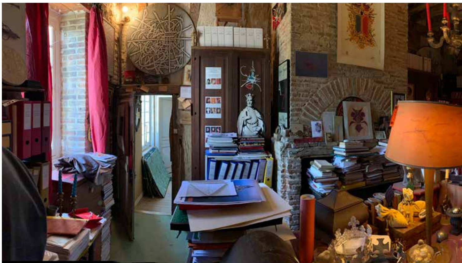
Archives Jean-Marie Cusinberche à Vatteville, 2020.