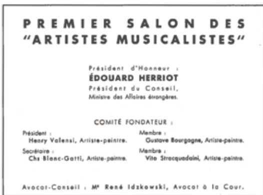
Catalogue du premier salon musicaliste, 1932.

Le manifeste complet, la liste des expositions et des nombreuses références sont disponibles auprès de l'expert.