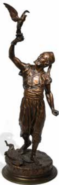
374 D'après Jules MENE (1810-1879) Le fauconnier arabe à pied Epreuve en bronze à patine mordoré, signée sur la terrasse porte une date 1873 H. 66 cm (accidents) 600 / 800 €