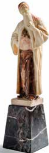
375 Ecole ORIENTALISTE , début du XX e siècle Personnage oriental Sculpture en albâtre reposant sur un socle en marbre. H. 29,5 cm. 200 / 300 €