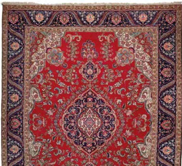
379 Très fin tapis persan Médailion central et champ à décor de rinceaux fleuris sur fond crème Naïn milieu du XX e siècle Dim 107 x 174 cm 700 / 900 €