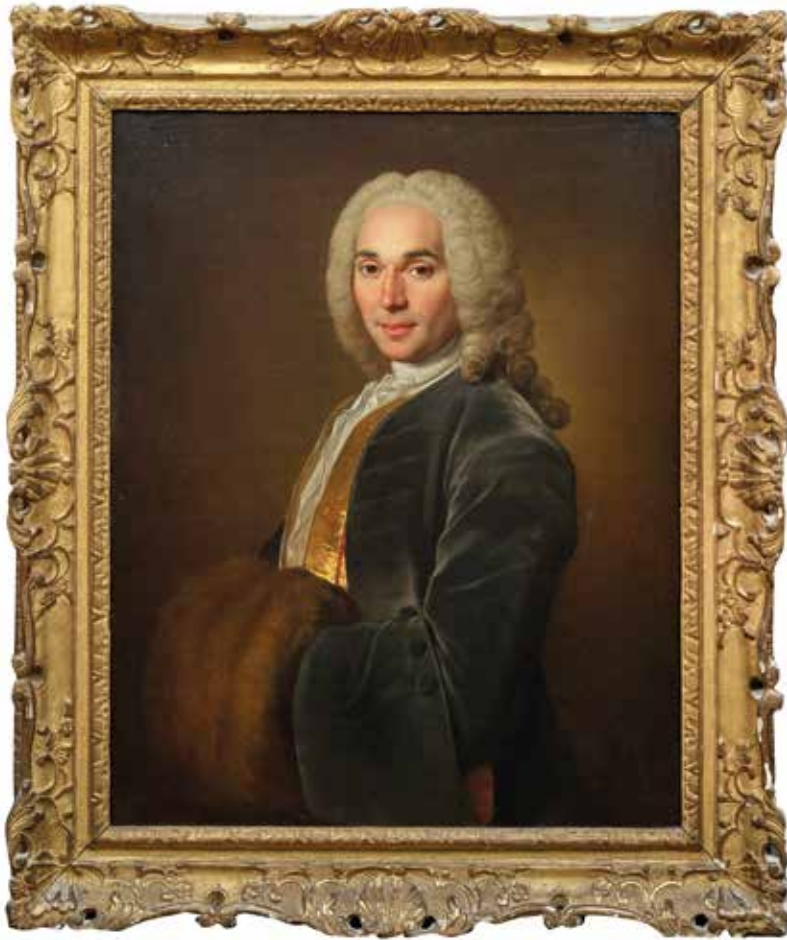
84 Ecole FRANCAISE, vers 1760, entourage de Louis TOCQUE Portrait d'homme au manchon de fourrure Toile 79,5 x 63,5 cm 1 500 / 2 000 €