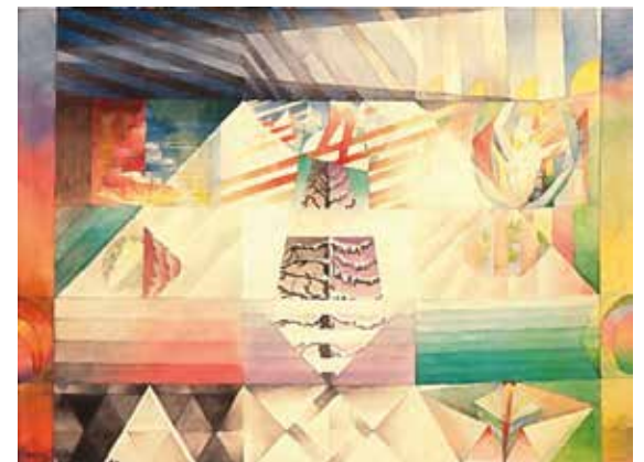
Étude pour la Symphonie hivernale, 1933, 33 x 25 cm.