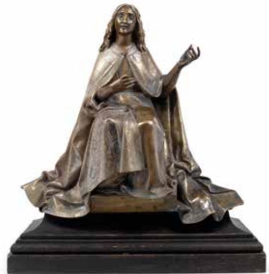
376 Ange musicien en bronze patiné. L'ange est représenté assis vêtu d'une longue cape ornée de motifs trilobés. Les mains semblent tenir un instrument de musique. Sur un socle mouluré en bois noirci. Fin du XIX e siècle, dans le goût nazaréen H. 46 cm. L. 48 cm. H. totale : 56 cm 1 800 / 2 000 €