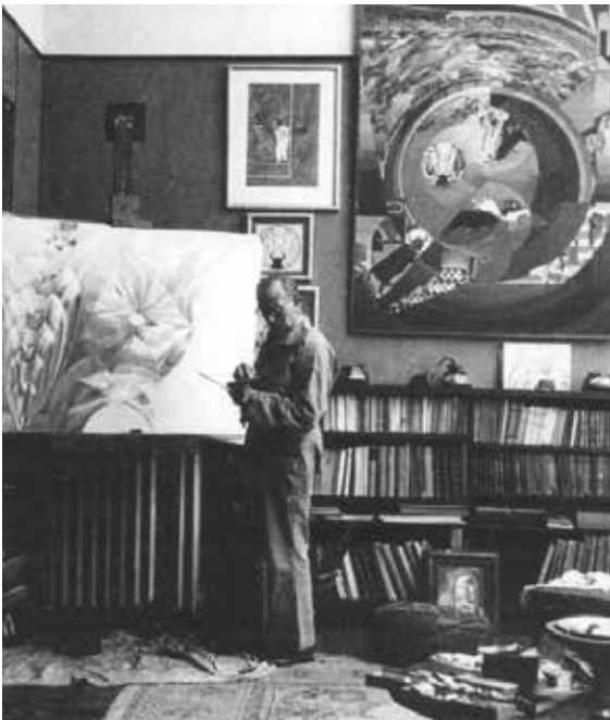
Henry Valensi dans son atelier, 1946.

Né à Alger, Valensi s'inscrit en 1898 aux Beaux-Arts de Paris et étudie dans l'atelier de Bonnat où il se forme au solide métier de dessinateur. Entre 1900 et 1912, il voyage dans toute l'Europe ainsi qu'en Russie et Turquie, y propageant pendant quelques années une peinture néo-impressionniste assez proche par le traité de celle de Picabia à cette même période.