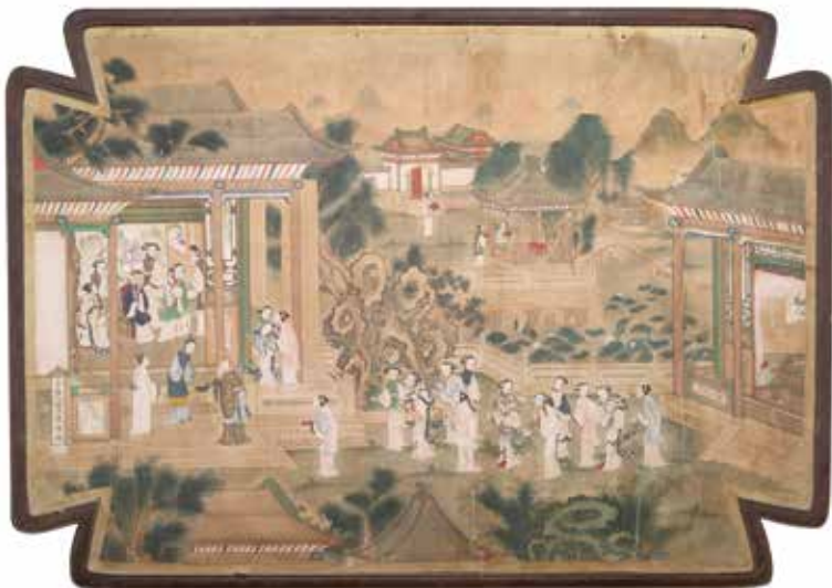
296 CHINE - Vers 1900 Ensemble de cinq peintures , encre et couleurs sur papier, représentant des scènes du roman "Hong Lou Meng". Dim. à vue : 109 x 159 cm Encadrées (Nombreuse restaurations) 8 000 / 12 000 €