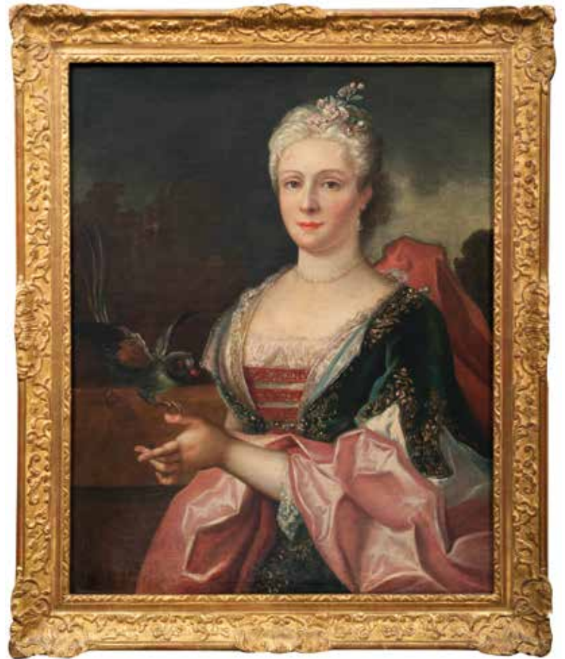
85 École FRANCAISE, vers 1760 Femme au perroquet Toile 78 x 63 cm Accidents, restaurations 400 / 600 €