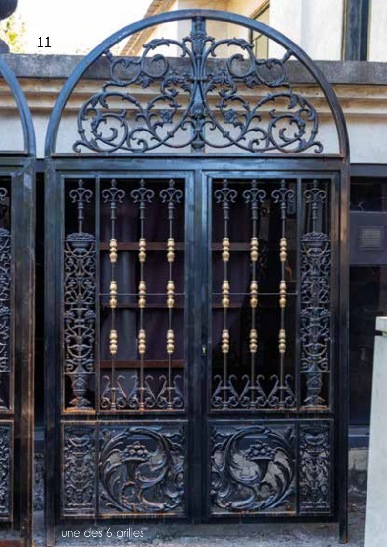
une des 6 grilles