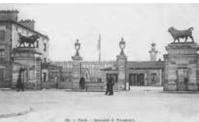
Abattoirs de Vaugirard, Paris