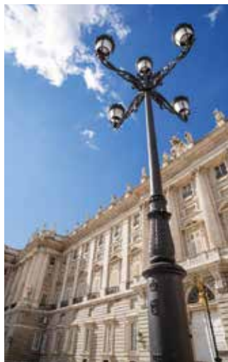
Lampadaire à Madrid, Espagne