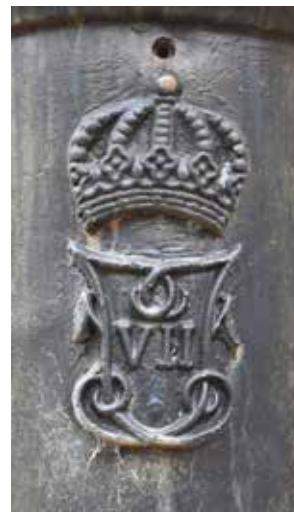
Couronne surmontant deux F's et un VII