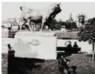
Exposition Universelle de 1878