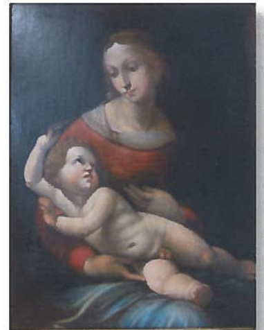
D'après Raphaël, « Vierge à l'enfant » huile. 74 x 57 cm (copie d'un tableau conservé en Ecosse)