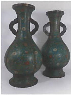
Paire de vases en cloisonné. Chine. H. 42 cm