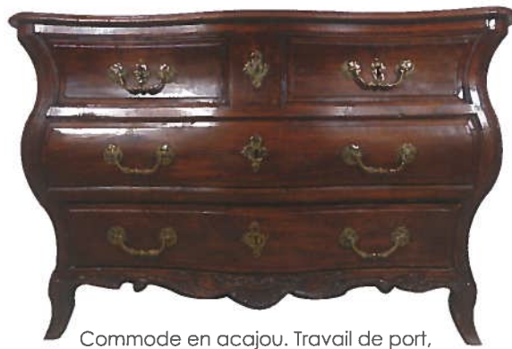
Commode en acajou. Travail de port, Bordeaux, XVIIIème s. 83 x 64 x 128 cm