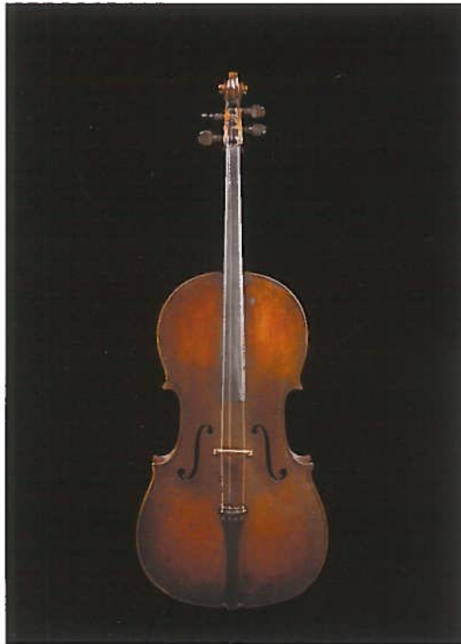
Violoncelle probablement de l'école allemande fait vers 1900-1920. Quelques restaurations sur les éclisses - Longueur : 760 millimètres