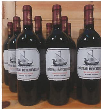
12 B de Bordeaux St Julien «Beychevelle» 2004