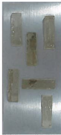
PERZEL, applique murale rectangulaire signée. 40 x 18 x 8 cm