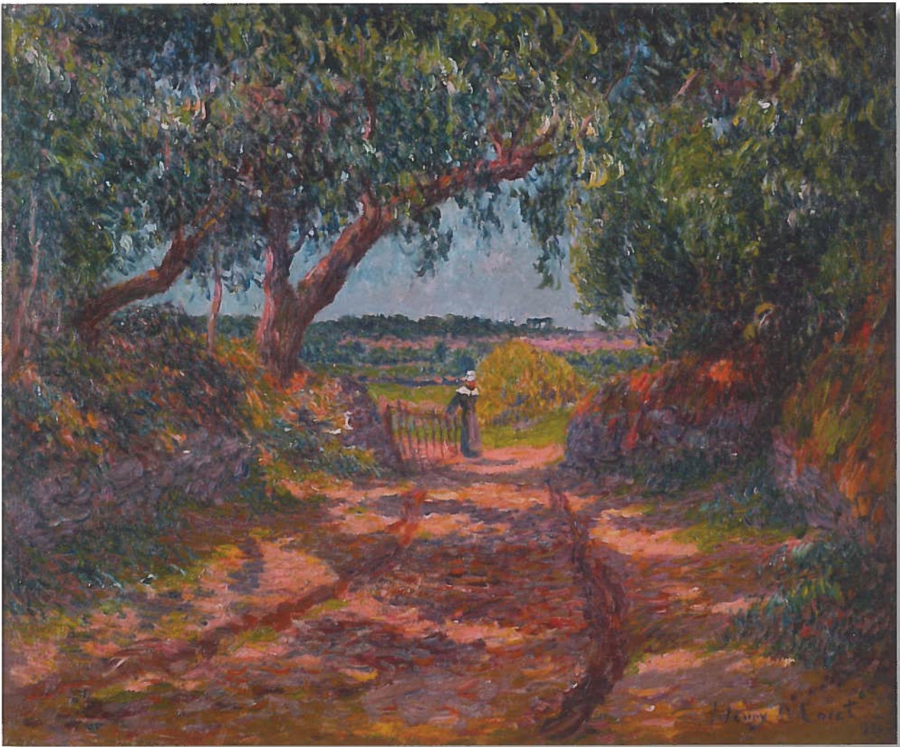
Henry MORET (1856-1913) Bretonne à la haie, chemin creux à Riec, Finistère 1899. Huile signée, 54 x 65 cm