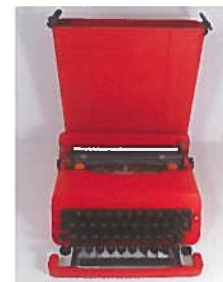
ETORE SOTSSAS & OLIVETTI, machine à écrire Valentine dans sa mallette

Experts : Cabinet d'expertise Marc OTTAVI - Expert en Tableaux - Tel. 01 42 46 41 91 Jean-Jacques RAMPAL - Expert en instruments à cordes frottées - Tel. 01 45 22 17 25 Jean-François RAFFIN, Sylvain BIGOT, Yannick Le CANU - Experts en arches - Tel. 01 55 30 01 47