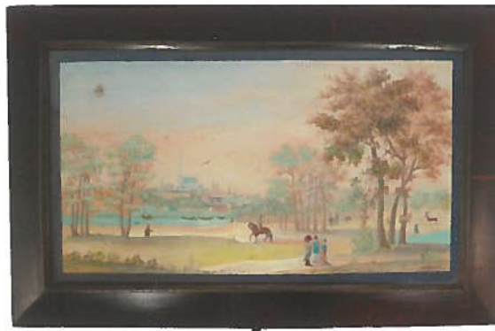
Boîte en placage dessus décoré d'une aquarelle signée B. WIGAND. 11 x 25 x 38 cm