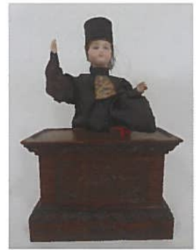
Automate «Avocate». 30 x 19 cm