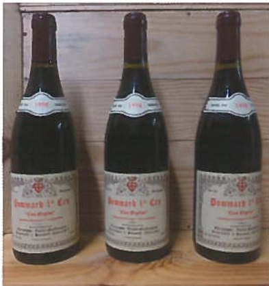
3 B de Bourgogne Pommard «Clos Orgelot» 1998