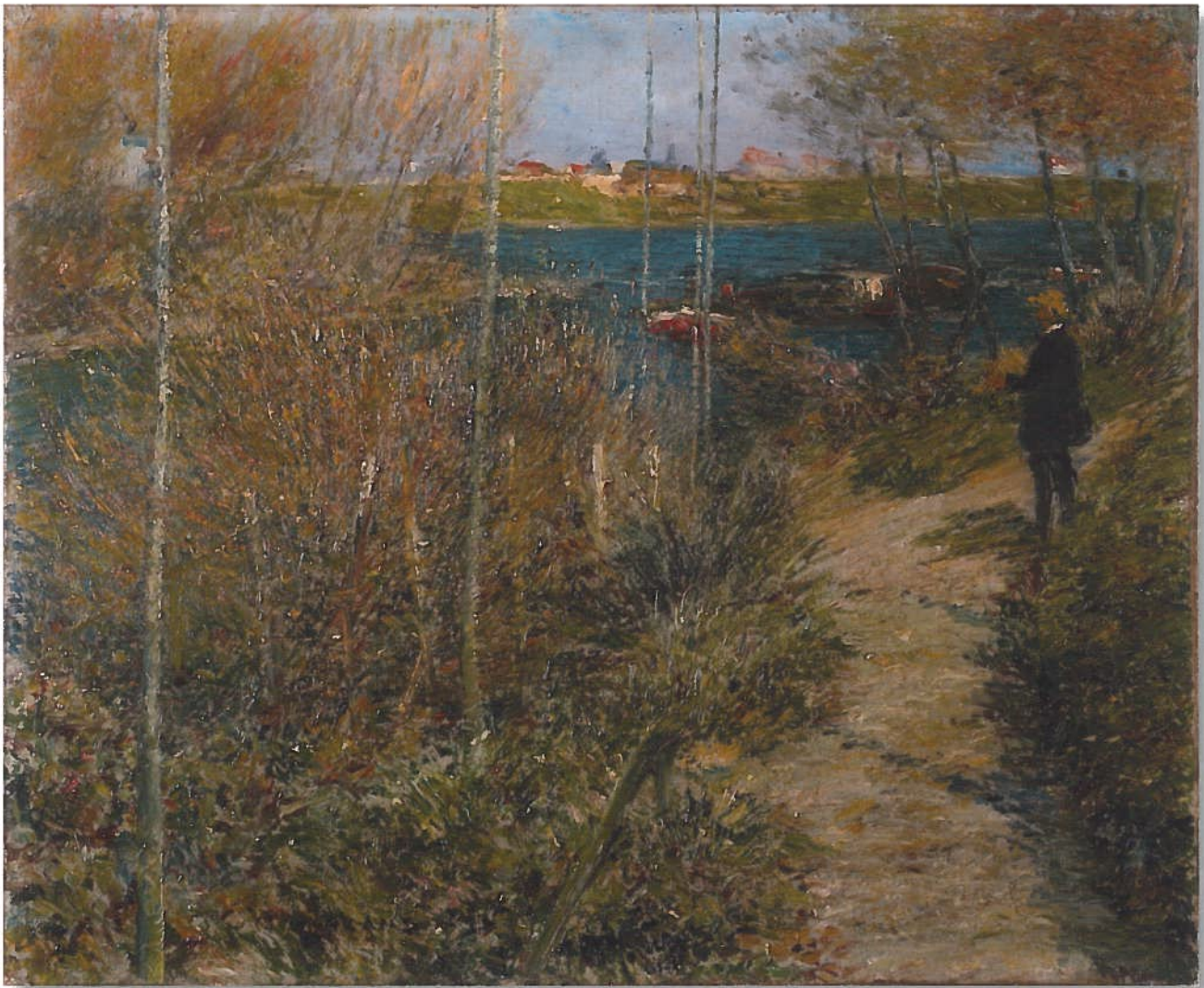
Charles ANGRAND (1854-1926) Promeneur au bord de l'eau circa 1884. Huile signée, 46 x 55 cm