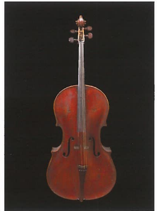
Intéressant violoncelle fait vers 1820-1830 - Cassure d'âme sur la table et différentes restaurations sur les éclisses - Longueur : 757 millimètres