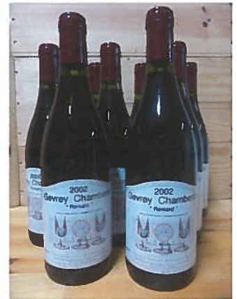
9 B de Bourgogne Gevrey Chambertin «Reniard» 2002

Expositions : Vendredi 18 décembre de 10h à 12h et de 14h à 18h et Samedi 19 décembre de 9h15 à 11h