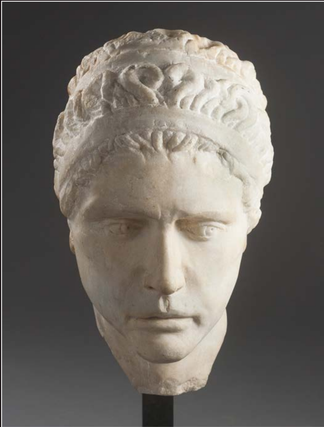
121. Tête de prince Marbre anatolien, Afyon-Dokimeion. Art byzantin, Ve-VIe siècle Ancienne identification comme un prince Ptolémée Haut. : 32 cm - Larg. : 18 cm - Prof. : 24 cm Reprises prononcées, visibles au niveau de la coiffe et au visage. 40 000 / 60 000 € ..... AA L'étude minéralogique du Dr Philippe Blanc (UPMC Paris Sorbonne) sera remise à l'acquéreur