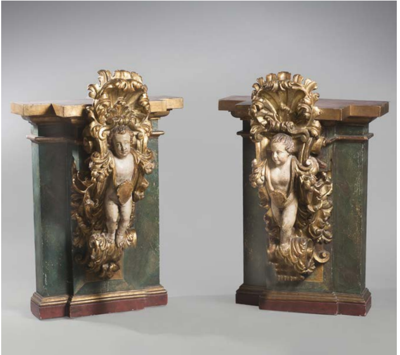
236. Paire d'éléments décoratifs en bois sculpté, polychrome et or. Ils représentent deux putti supportés par une console à volutes feuillagés surmontée d'une coquille. XVIIe siècle. Pilastres saillants moulurés et relaqués. H. 100 cm. L. 64 cm. P. 50 cm. 8 000 / 10 000 € ..... PC