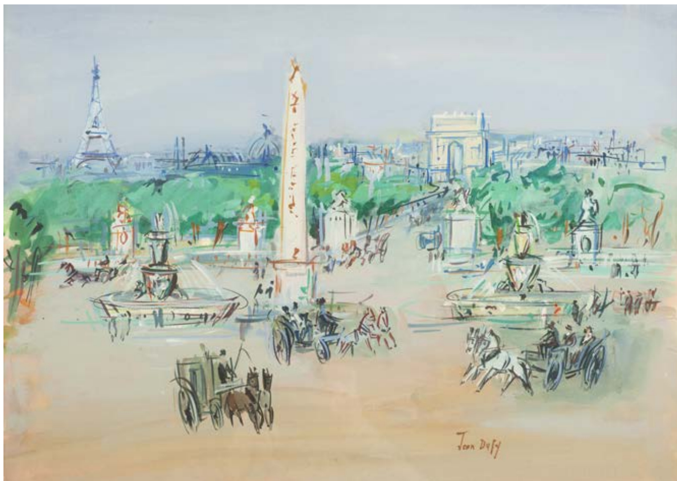
82. Jean DUFY (1888-1964) Vue des Champs Elysées depuis la Concorde Gouache Signée en bas à droite 45 x 63 cm 18 000 / 22 000 €