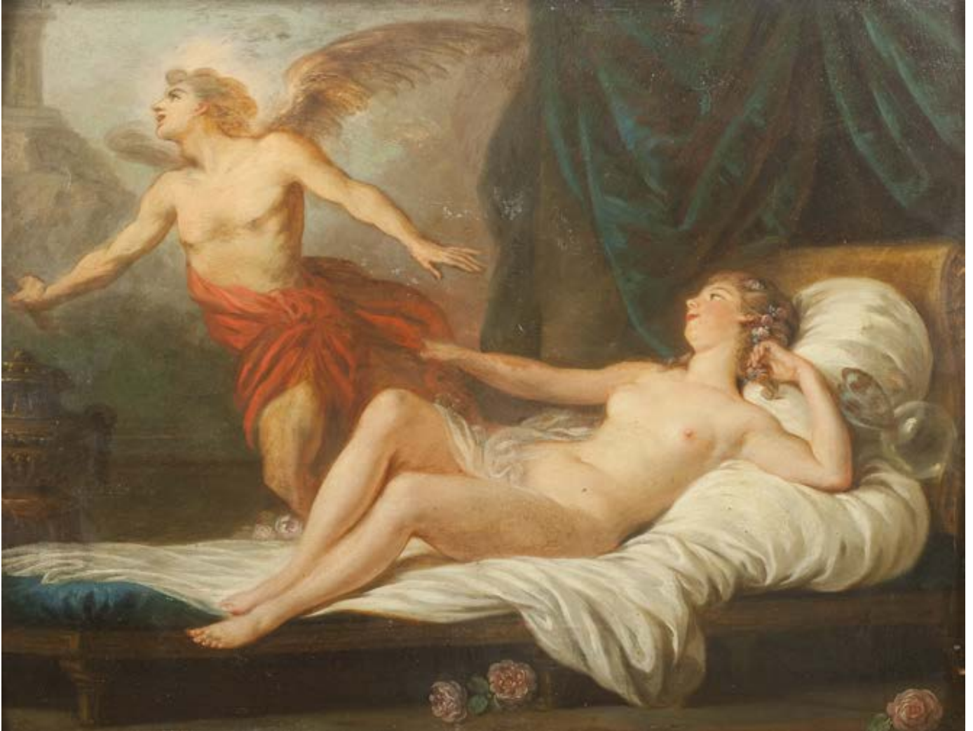
38. Ecole FRANCAISE du XVIIIe siècle Vénus et l'Amour Panneau 31,5 x 41 cm 2 000 / 3 000 €