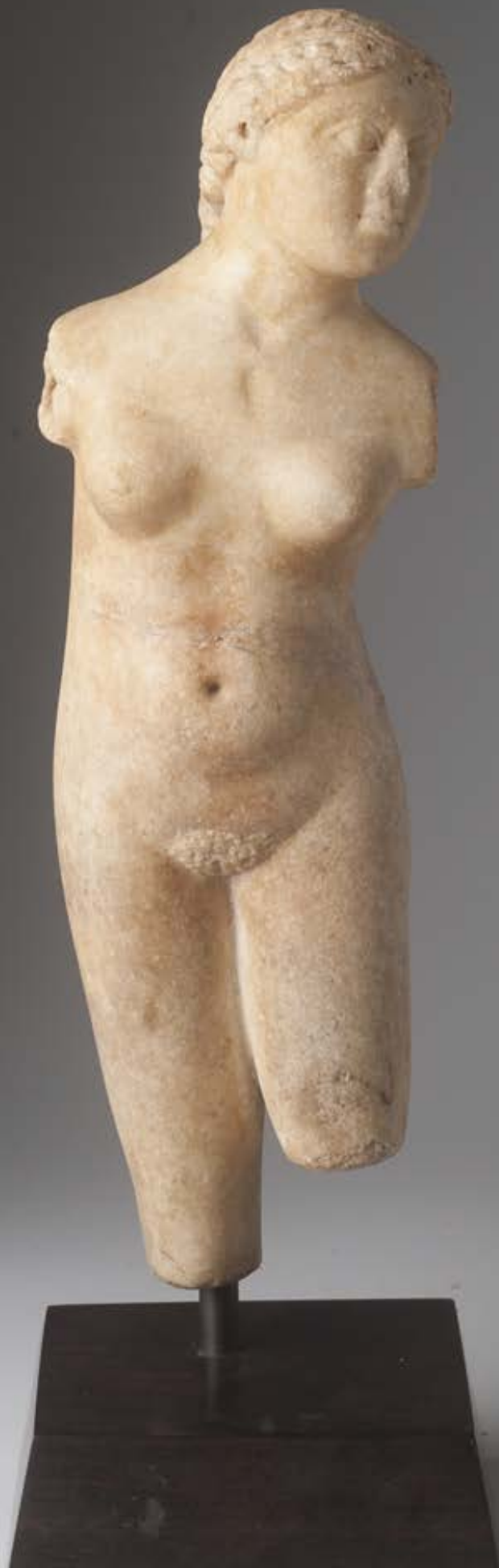
115. Vénus Marbre blanc Epoque romaine Haut. : 28 cm Lacunes et reprises. Restaurations 6 000 / 7 000 €