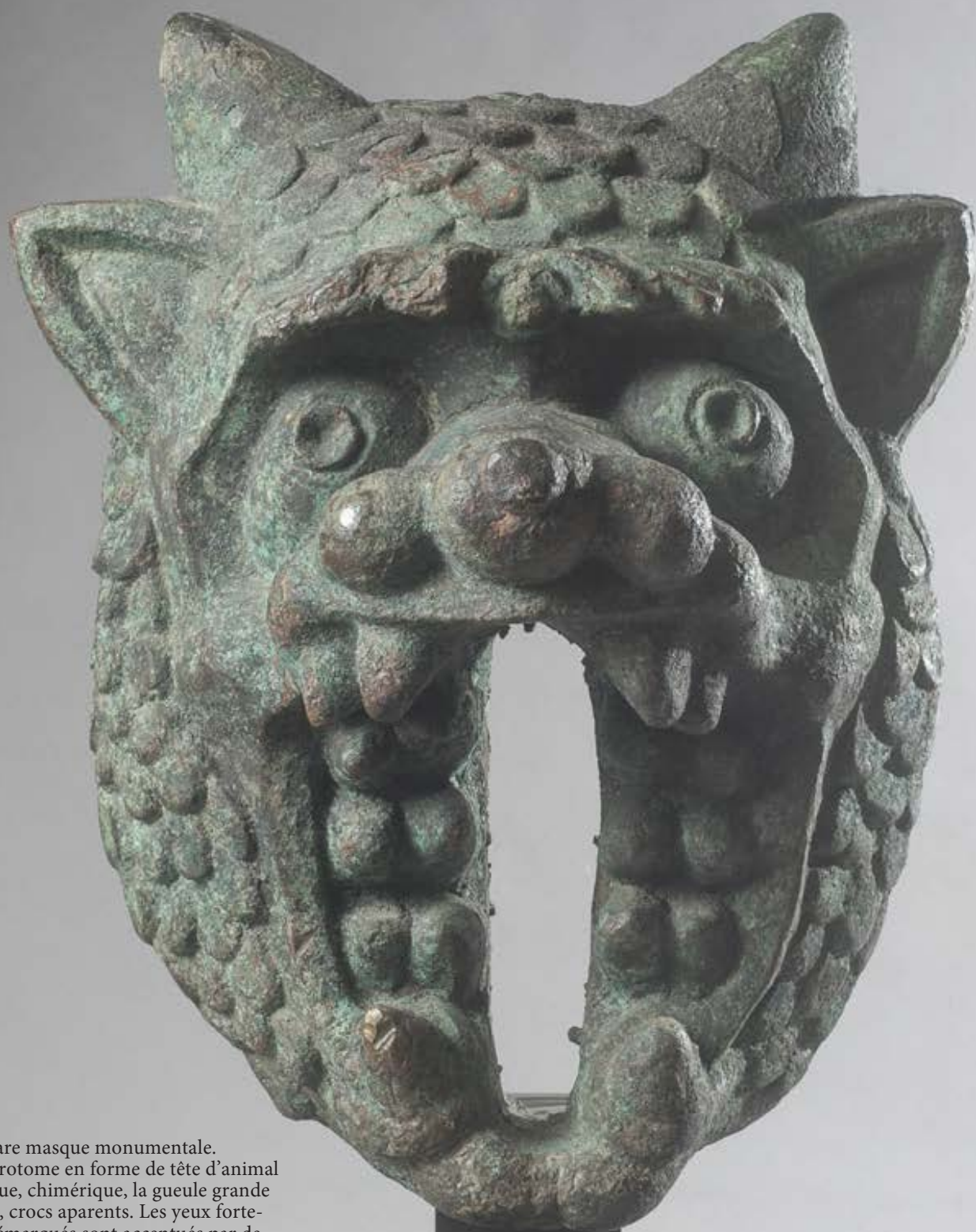
118. Rare masque monumentale. Large protome en forme de tête d'animal grotesque, chimérique, la gueule grande ouverte, crocs aparents. Les yeux forte- ment démarqués sont accentués par de profondes pupilles. Bronze à forte oxydation. Epoque romaine Haut. : 39 cm. 40 000 / 60 000 € ..... AA

Prov. : Anc. collection Alexander Biancardi Une étude de datation pourra être faite à la demande de l'acquéreur