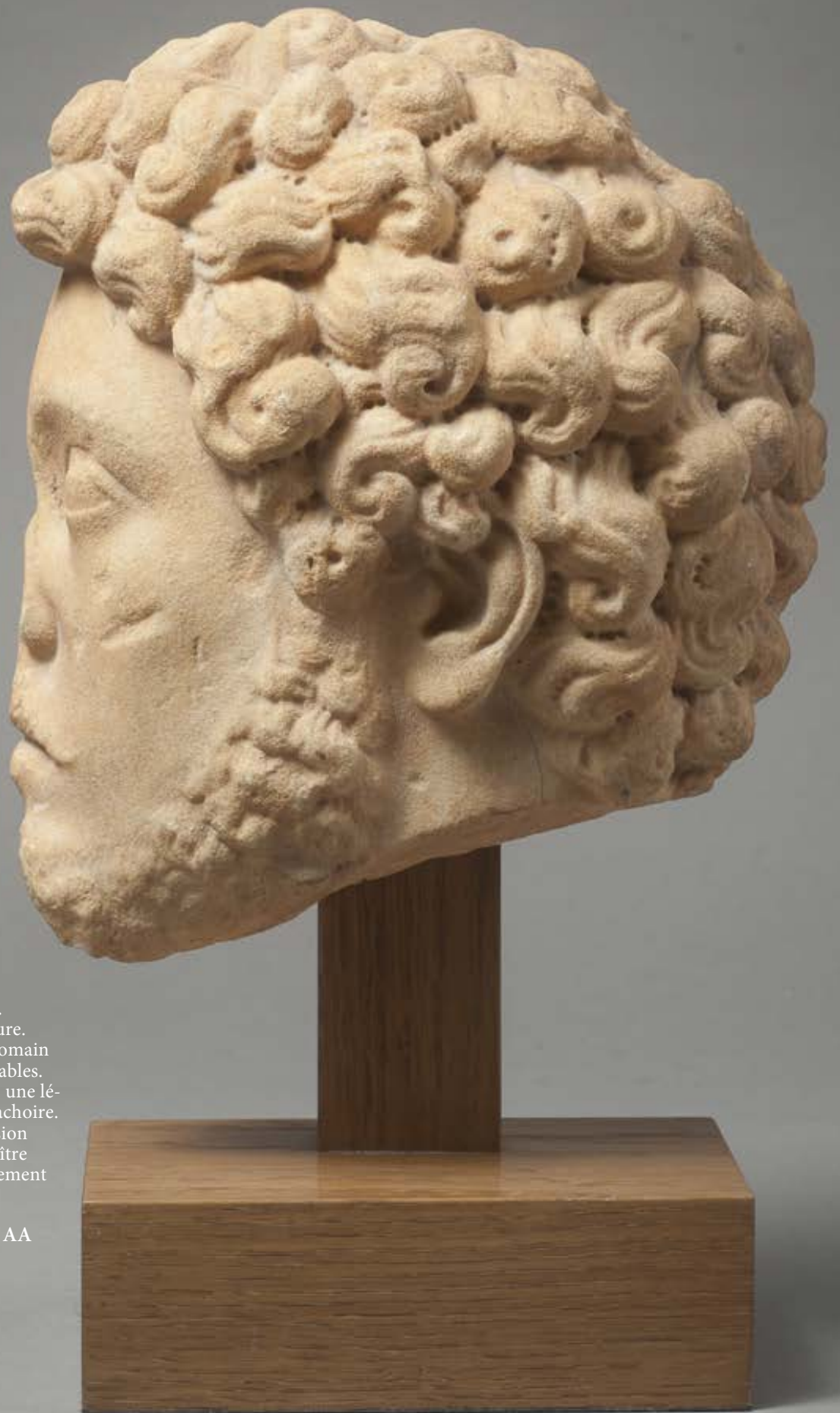
111. Profil présumé de l'empereur Commode. II e s. ou reprise postérieure. Les traits de l'empereur romain sont aisément reconnaissables. Les cheveux sont fouillés, une lé- gère barbe parcourt la mâchoire. Le marbre à patine d'érosion orangé-rose laisse apparaître une pupille presque totalement effacée. Haut. : 19 cm. 8 000 / 12 000 € ..... AA