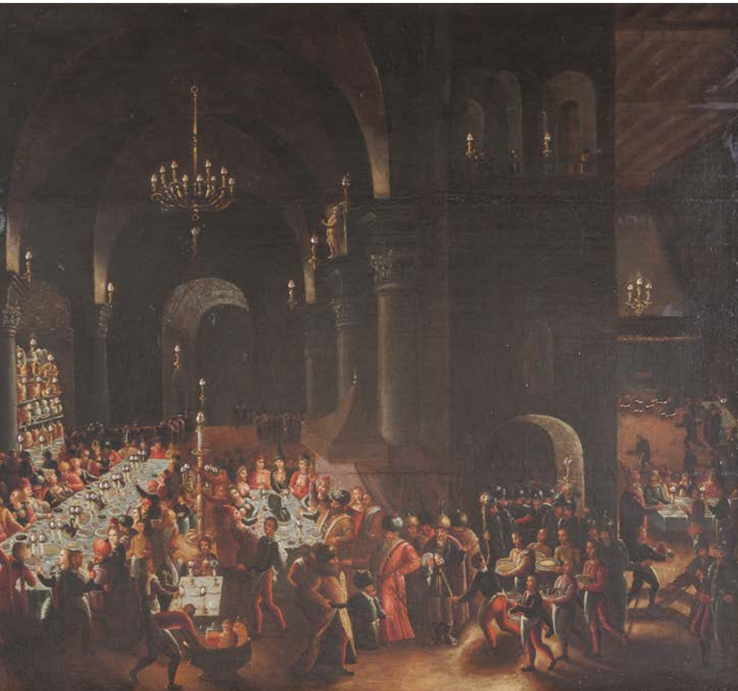
50. Ecole FLAMANDE vers 1620, entourage de Louis de CAULLERY Le banquet de Balthasar Panneau inséré

Porte une inscription en bas à gauche Franck 1560.