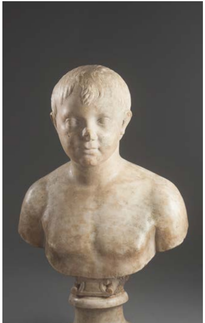
117. Buste d'enfant. Tête d'époque romaine Buste du XVIe siècle. Marbre patiné. Haut. 39 cm (haut. totale 48 cm) Restaurations anciennes visibles. 25 000 / 30 000 € ..... AA