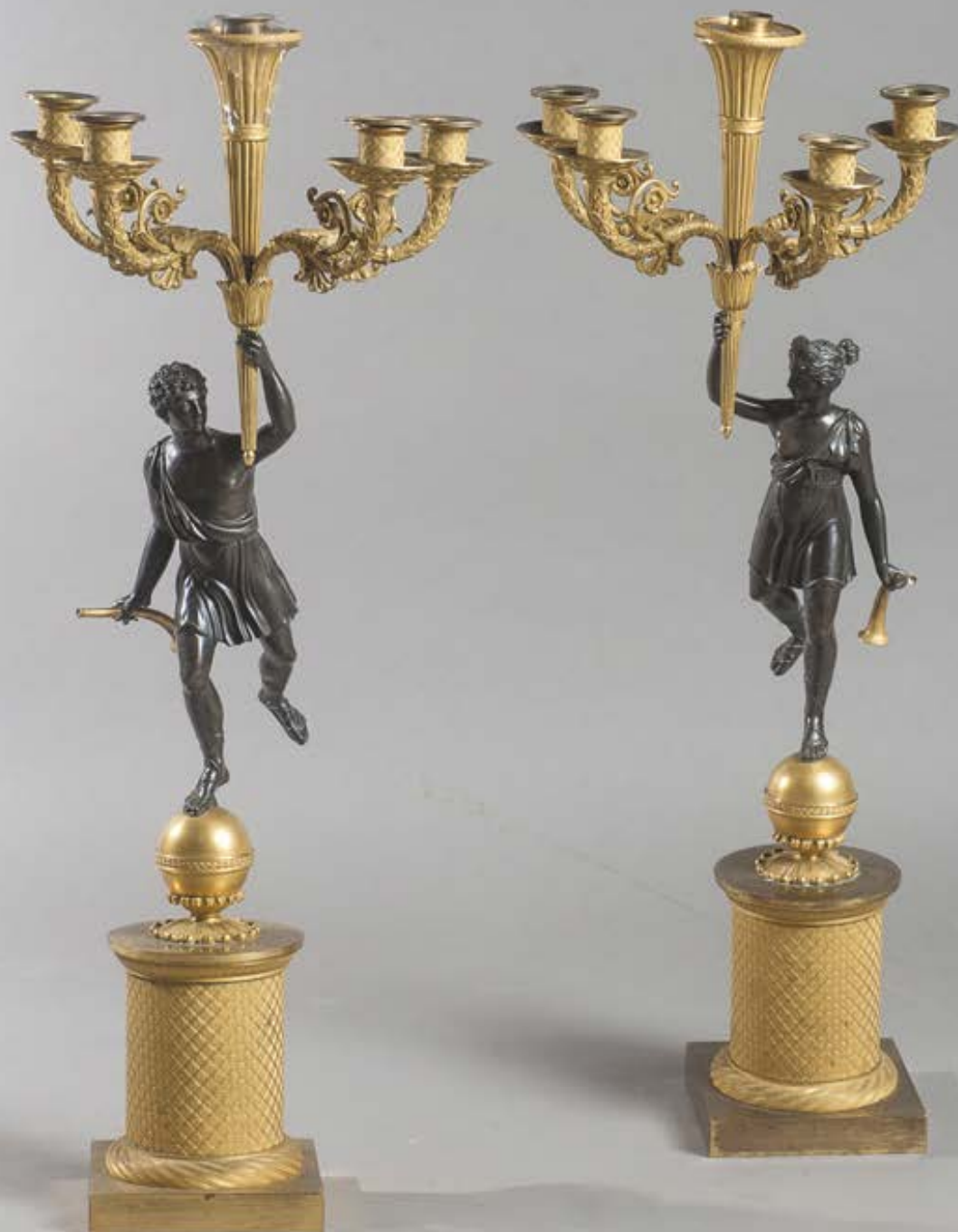
252. Paire de candélabres en bronze ciselé, doré et patiné. Elle représente un jeune homme et une jeune fille antiques courant et brandissant une torche à cinq bras de lumière feuillagés. Supportés par une sphère et un fût cylindrique guilloché.