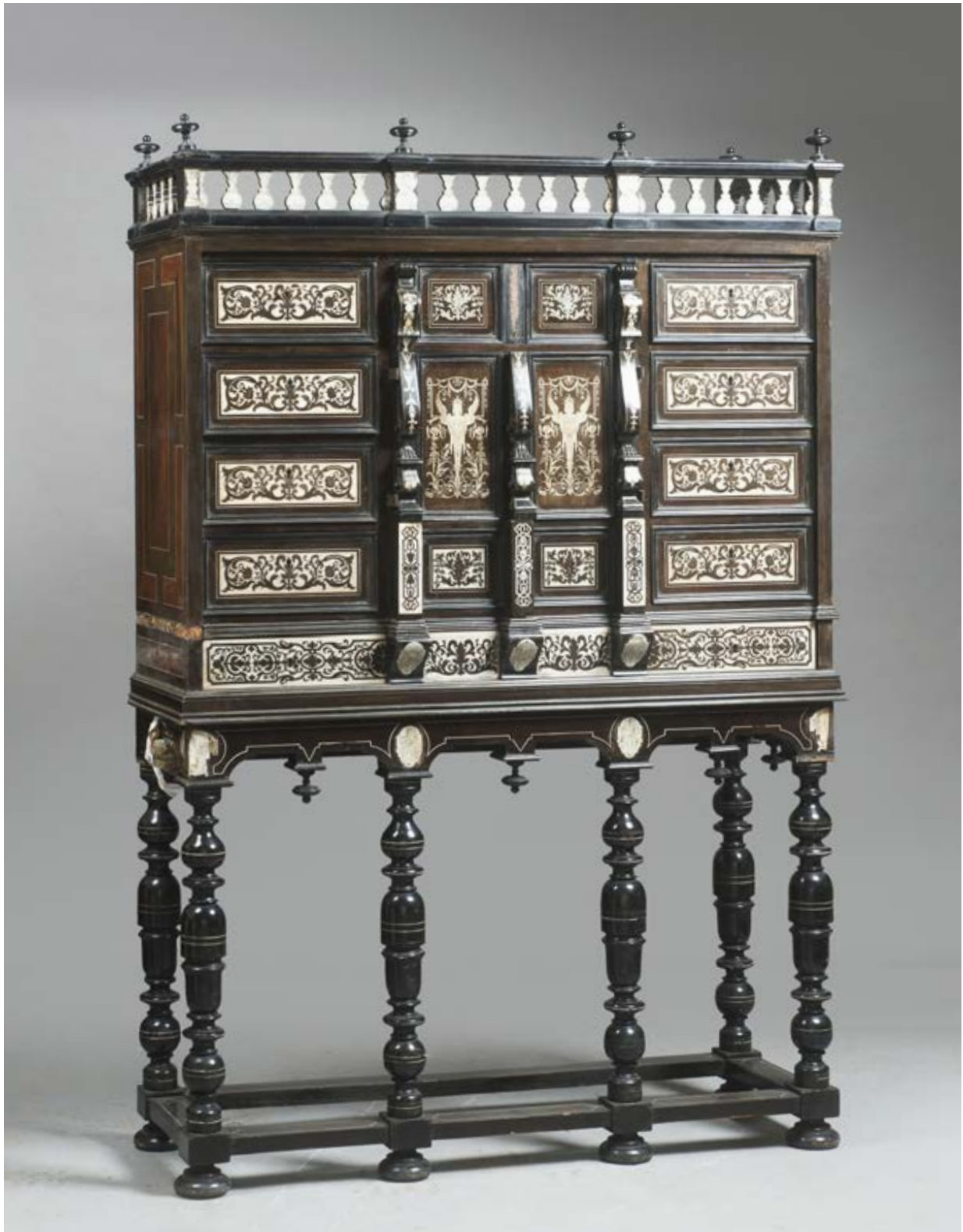
241. Cabinet en bois noirci, placage d'ébène et de palissandre, à décor marqueté d'ivoire gravé. Il ouvre en façade par des tiroirs et des vantaux cantonnés de pilastres dévoilant un théâtre à colonnettes et arcatures en placage d'écaille, sol à damier et fond de miroirs. Les tiroirs et les montants sont à décor incrusté de rinceaux, les vantaux présentent des femmes aillées en termes dans un entourage de branchages feuillagés. La ceinture est soulignée d'arcatures ornées de décus à lambrequins. XVIIe siècle. Coiffé d'une balustrade rythmée de vases couverts. Piétement en balustre réuni par des traverses. Restaurations. H. 181 cm. L. 120 cm. P. 40 cm. 18 000 / 20 000 € ..... PC