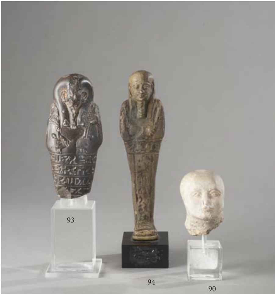
90. Tête masculine. Egypte, Ancien Empire. Fin du IV e mill. Av. J.-C. Les traits du visage sont finement sculptés, les cheveux sont courts, la coiffe est canonique. Calcaire. Haut.: 5,5 cm. Manquent les oreilles. Prov. : Ex. Christie's. 1 200 / 1 500 € ..... AA