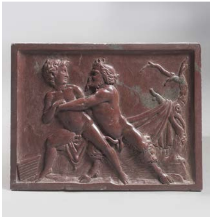
229. D'après l'Antique. Satyre enlaçant un jeune homme Bas-relief en marbre rosso antico. Travail italien, XIXe siècle. 25,5 x 33 cm. Ce type d'objet dans le goût antique était produit par les ar- tistes italiens à destination des aristocrates étrangers ayant entrepris le Grand Tour. 4 000 / 5 000 € ..... PC