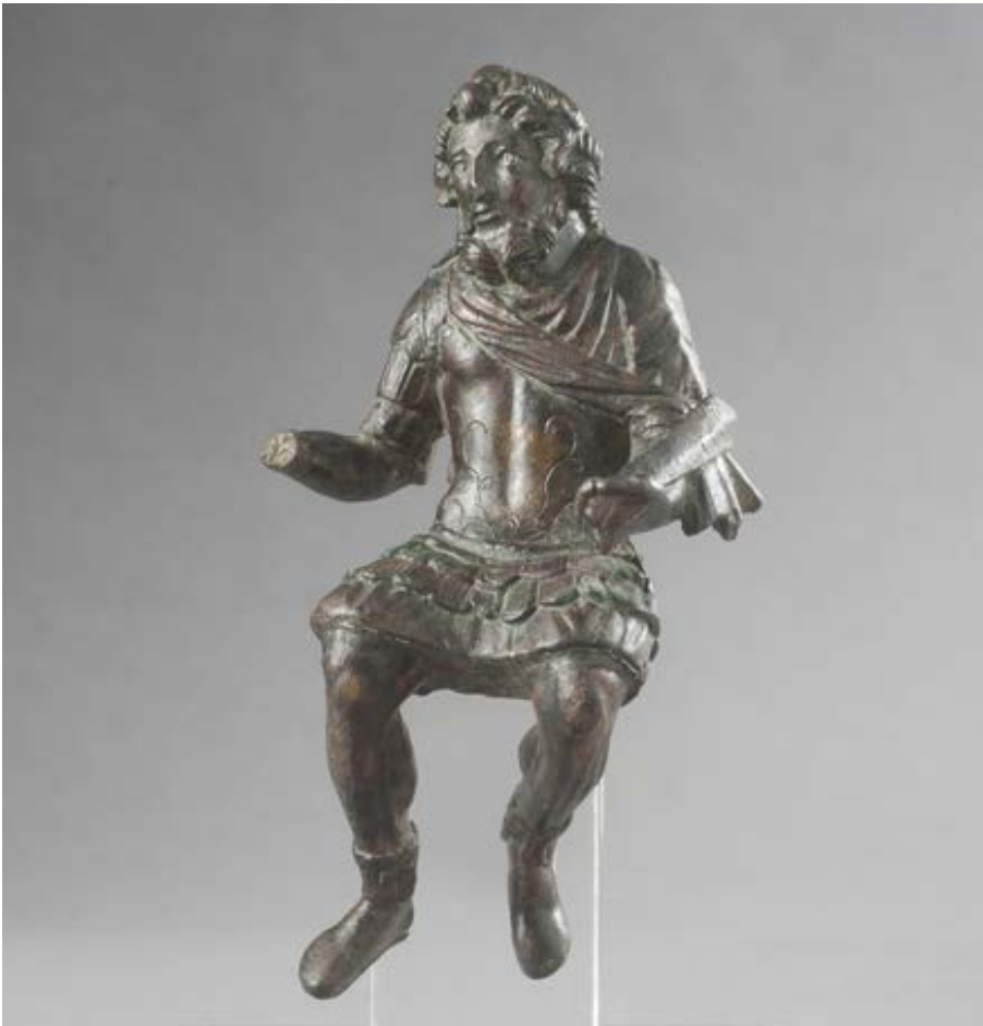
124. Statuette au portrait présumé de Marc Aurèle. Epoque romaine. L'empereur est représenté cuirassé, un glaive dans la main gauche reposant sur son avant bras. L'armure est détaillée, incisée de motifs, la jupe écaillée était jadis, comme la cuirasse, recouverte de feuilles d'argent dont seuls restes pour témoignage des fragments dans les sillons où elles prenaient naissance. Un large tenon est présent à l'arrière. Les yeux sont incrustés d'argent. Il s'agirait vraisemblablement d'une fonte gallo-romaine. Bronze. Haut. : 14 cm. Provenance : ancienne Collection parisienne. Acquis en Allemagne, trouvé en France dans les années 20 30 000 / 50 000 € ..... AA