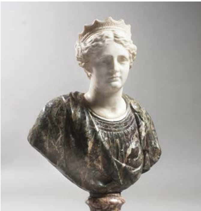
228. D'après l'Antique. Buste de femme coiffé d'un diadème. Sculpture en marbres blanc et polychromes, sur pié- douche. Travail probablement italien, XVII/XVIIIe siècle. H. 45 cm. L. 32 cm. 5 000 / 6 000 € ..... PC