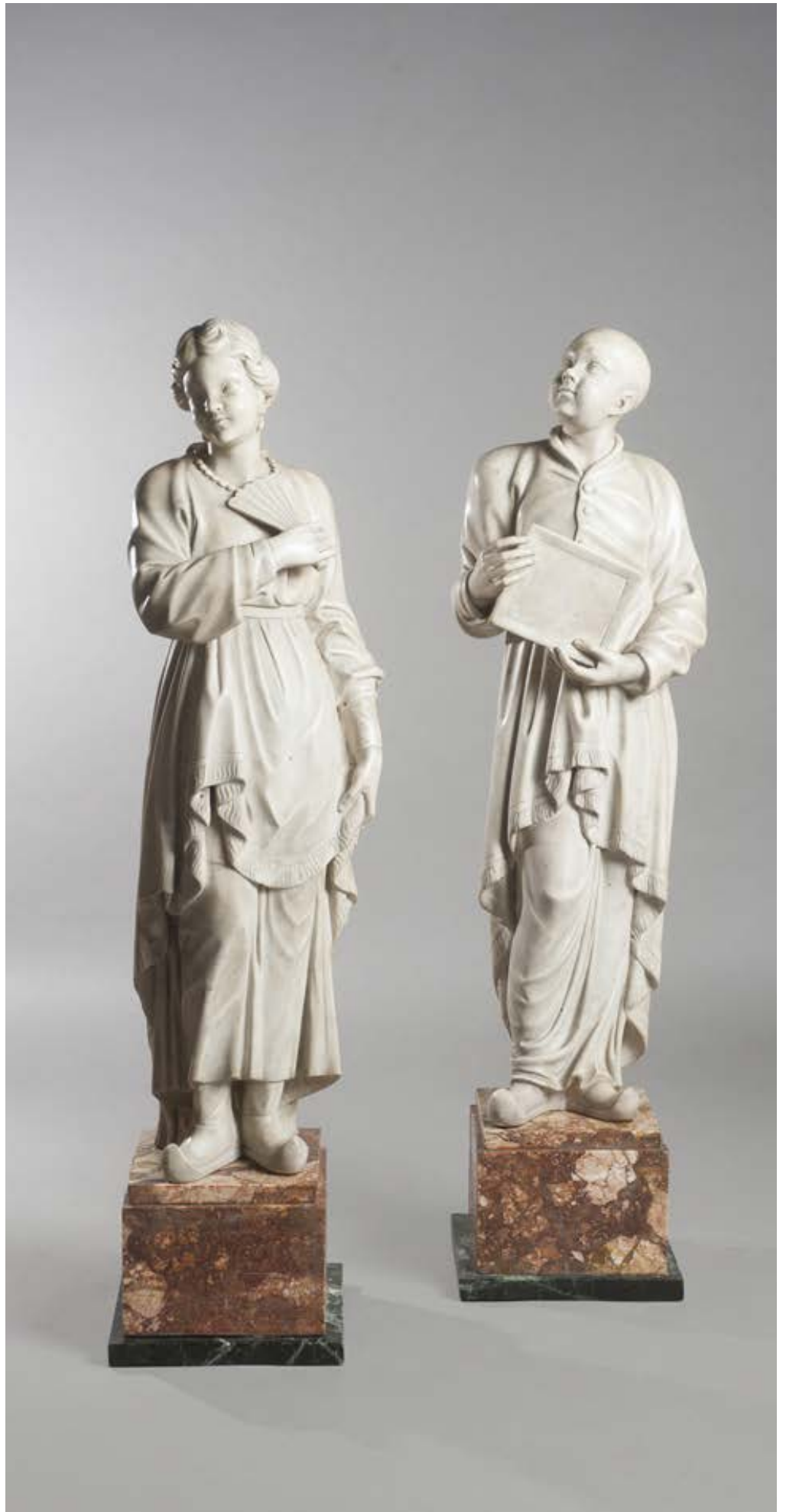
309. Paire de personnages chinois Sculptures en marbre blanc représentant un couple de chinois. Sur des bases carrées rapportées en marbre polychrome. Probablement Italie du nord début du XIXe siècle. H. totale : 89 cm. H. de chaque personnage : 73 cm. 30 000 / 35 000 € ..... PC