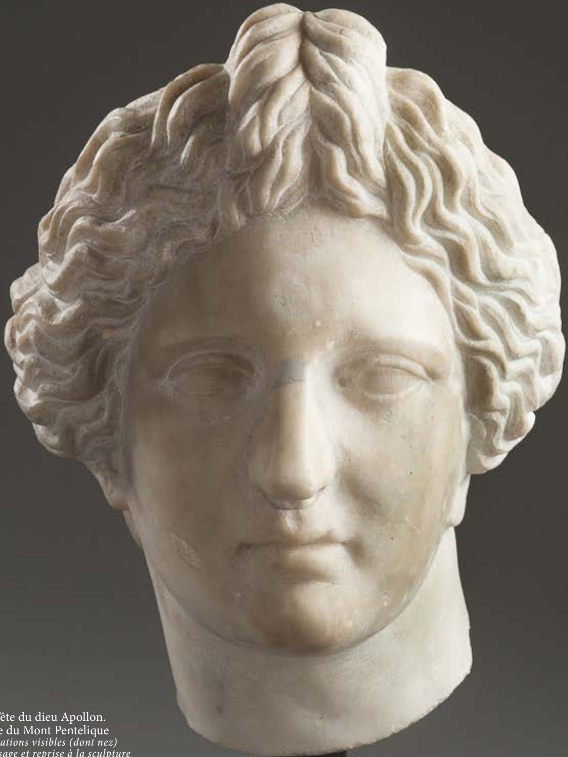
133. Tête du dieu Apollon. Marbre du Mont Pentelique Restaurations visibles (dont nez) Repolissage et reprise à la sculpture Haut. : 26 cm. 12 000 / 15 000 €

L'étude minéralogique du Dr Philippe Blanc (UPMC Paris Sorbonne) sera remise à l'acquéreur