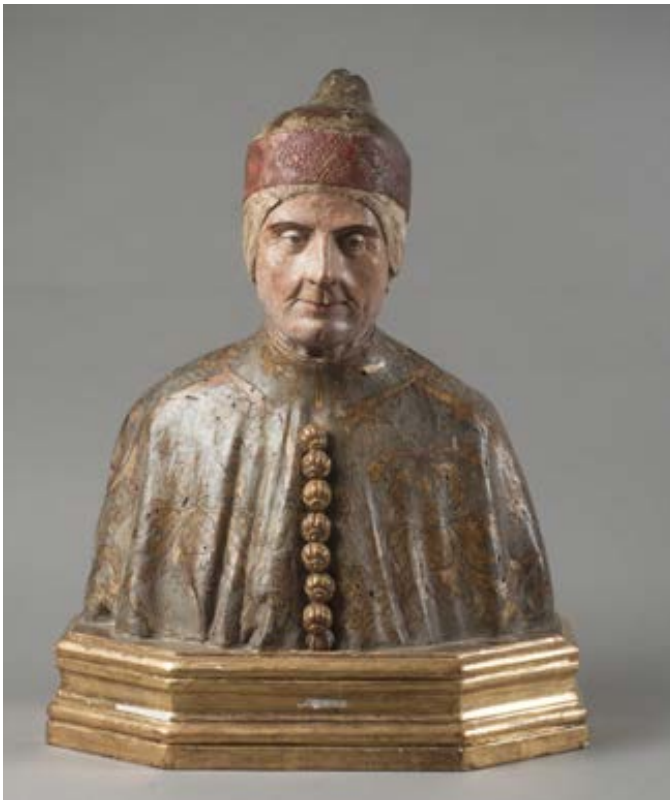
226. Buste du Doge de Venise, Léonardo Loredan Terre cuite polychrome et dorée, bois doré Venise, début du XVIe siècle Haut. : 36 cm - Larg. : 34 cm - Prof. : 21 cm (Avec la base 43 x 34 x 21 cm) 7 000 / 8 000 €