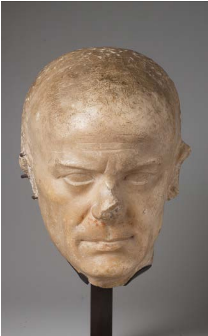
116. Portrait de patricien. Epoque romaine. Marbre, polissage et reprises à plusieurs endroits, le visage semble avoir été épargné. Tenon visibles. Haut. : 24 cm. 20 000 / 25 000 € ..... AA