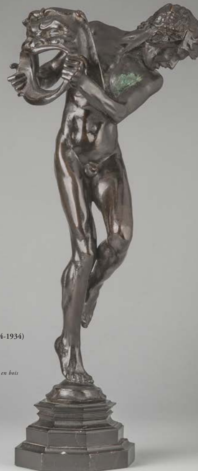
204. Sir Alfred GILBERT (1854-1934) Comédie Bronze à patine noire Signé sur la terrasse Haut. : 36 cm Traces d'oxydation. Repose sur un socle en bois noirci. 8 000 / 10 000 € ..... MO