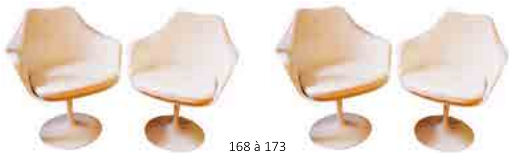
168 à 173