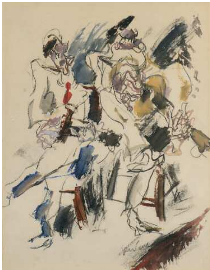
35 GEN PAUL (1895-1975) « L'Orchestre, circa 1928 » Fusain, gouache et aquarelle. Signé en bas à droite 61 x 48 cm à vue 4 000/5 000 €