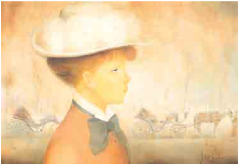
345 ► Elégante à la calèche Huile sur toile signée en bas à droite 37.5 x 54.5 cm

André Guégan définit l'univers de cet artiste comme : « quelque chose de posé, de réfléchi au pouvoir d'évocation qui émeut les âmes ».