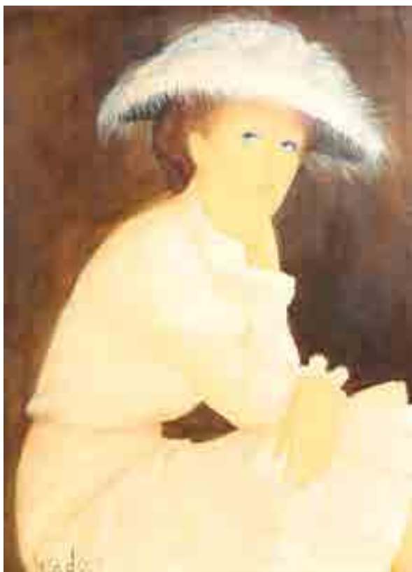
347 ► Elégante au chapeau Huile sur toile signée en bas à gauche 73 x 54 cm