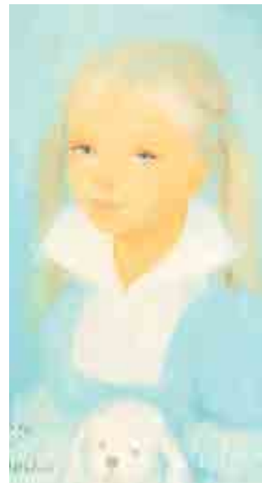
346 ► Petite fille au chien Huile sur toile signée en bas à gauche 33 x 19.5 cm