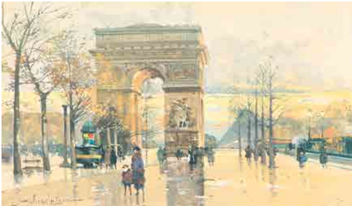
299 ► L'Arc de Triomphe, Paris Aquarelle Signée en bas à gauche 18 x 30.5 cm