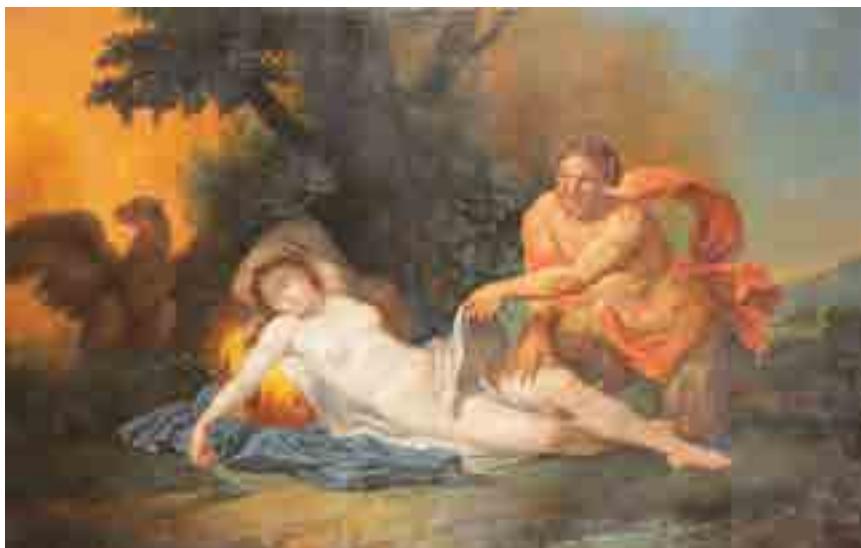
216 bis ▶ Ecole Française du XIX e siècle