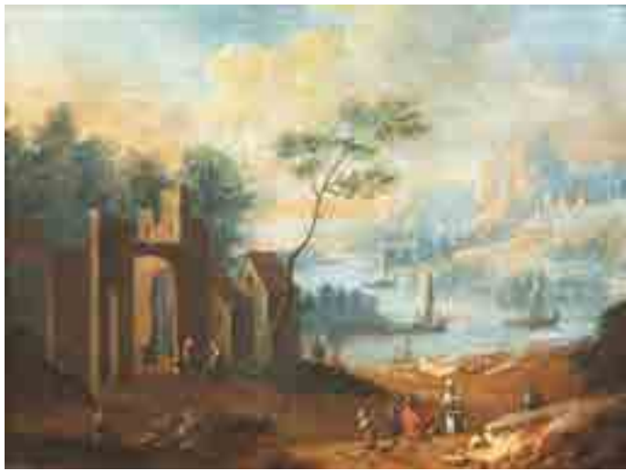
214 ▶ Marc BAETS, maître Anversois (XVII-XVIII e siècle)