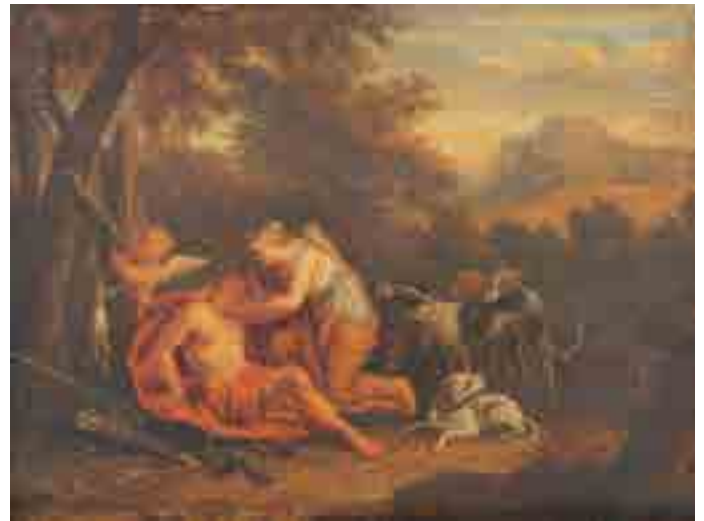
216 ▶ Gérard HOET (1648-1733)