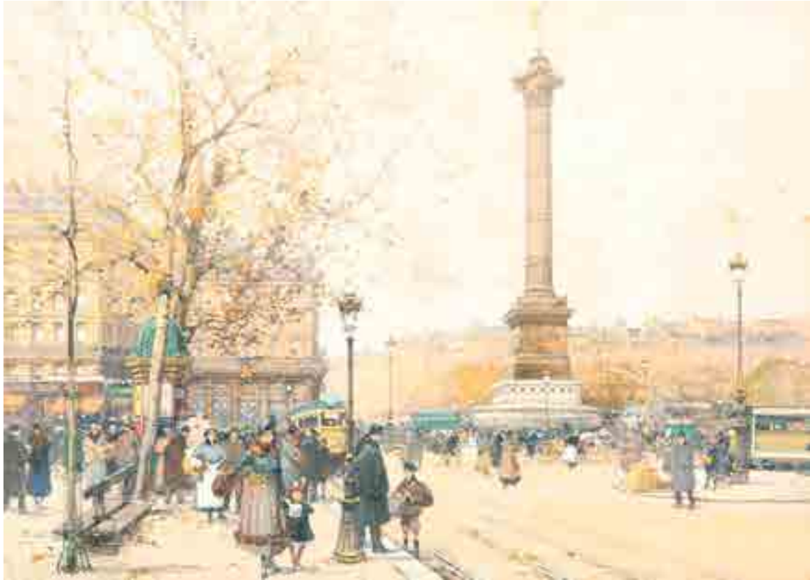
298 ► Place de la République, Paris Aquarelle Signée en bas à gauche 33 x 44.5 cm