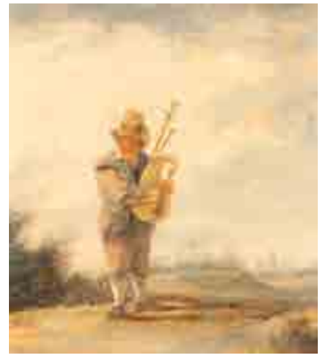
215 ▶ Ecole flamande du XVII e siècle