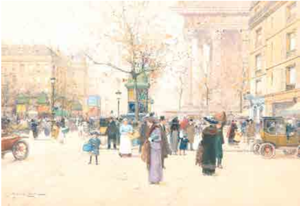
300 ► Place de la Madeleine, Paris Aquarelle signée en bas à gauche 32 x 44.5 cm