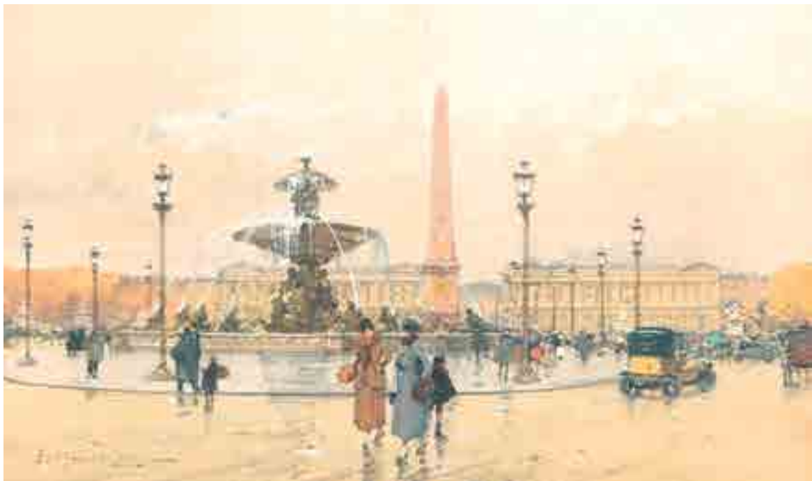
301 ► Place de la Concorde, Paris Aquarelle signée en bas à gauche 18 x 30.5 cm