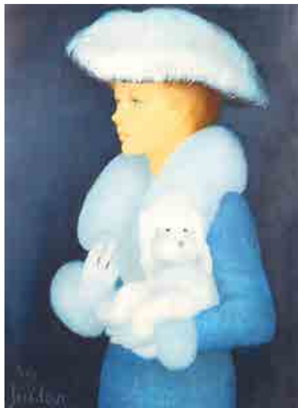
348 ► Elégante au caniche Huile sur toile signée en bas à gauche 73.5 x 54 cm