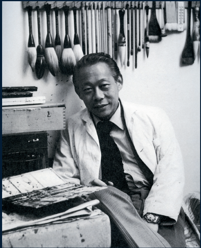
Zao Wou-Ki dans son atelier Zao Wou-Ki in his studio

Zao Wou-Ki's colours are so delicate, so subtle, ever so pulsating. This is his life, this is a dream. A constantly renewed landscape perpetually going forward. »